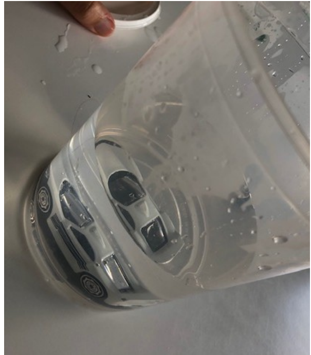
Doe een voorwerp (speelgoedje) in het water