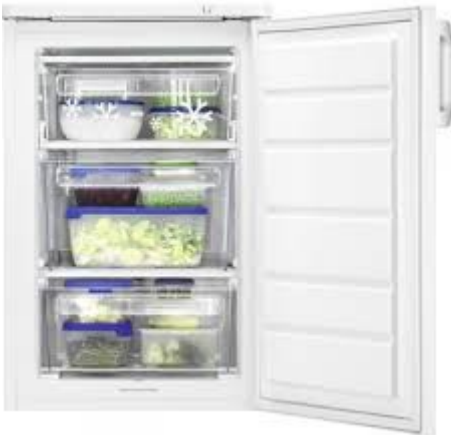
Steek het kommetje enkele uren in de diepvriezer