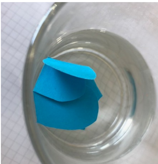
Leg de bloem in een bord of kommetje met een beetje water