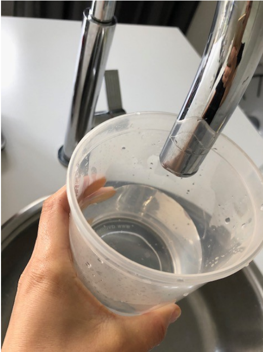
Vul een kommetje met water