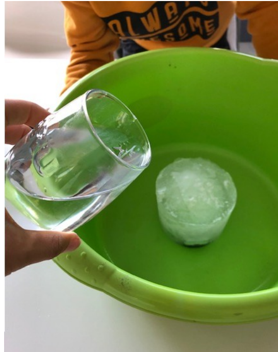
Met warm water?