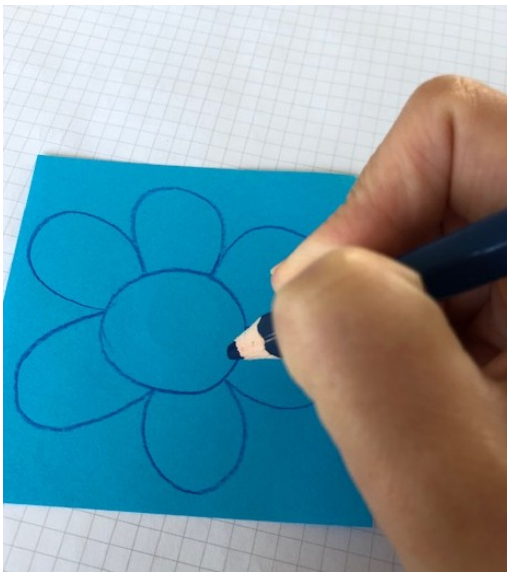
Teken een bloem op gekleurd papier