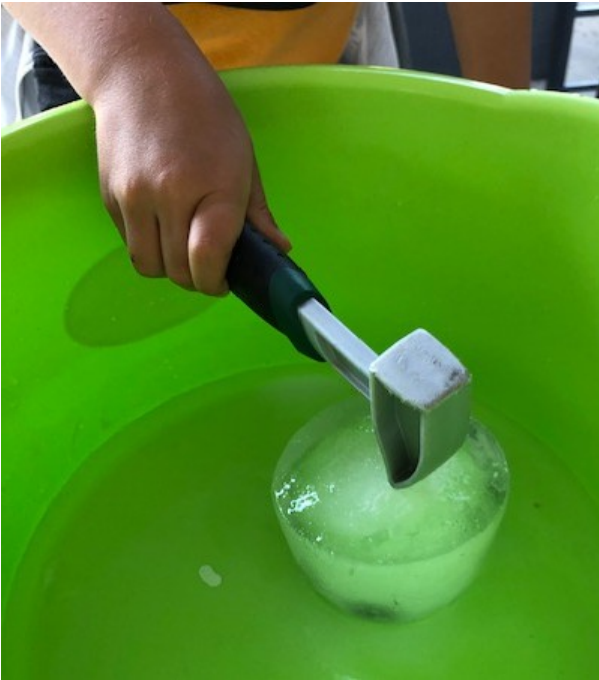
Met een speelgoed hamertje?

Hoe krijg je het speelgoedje uit de ijsblok? Wat gaat het gemakkelijkste?