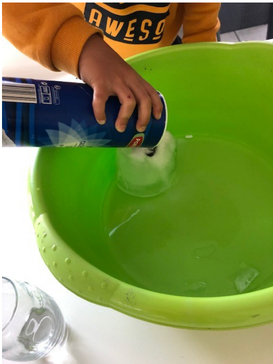
Met zout ?